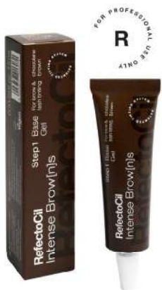
05036 Bazni gel Tamno Braon 15 ml

Srednje smeđa nijansa sa blagim toplim pod tonom. Preporučuje se za neutralne ili tople tipove kože. Koristi se u kombinaciji sa aktivator gelom.