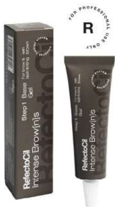
05038 Bazni gel Pepeljasto Braon 15ml

Intense Brow[n]s Intensifying Primer priprema kožu za ravnomerno nijansiranje. Izaberite Intensifying Primer Strong za veoma intenzivan rezultat.