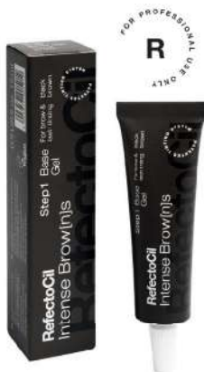
05035 Bazni gel Crno Braon 15 ml

Posebno tamna nijansa braon, za upečatljiv i privlačan izgled. Preporučuje se za nežne crte lica i tamnu kosu. Koristi se u kombinaciji sa aktivator gelom.