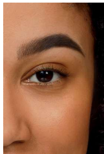
Tehnika popunjavanja obrva Za više oblikovane i definisane obrve.