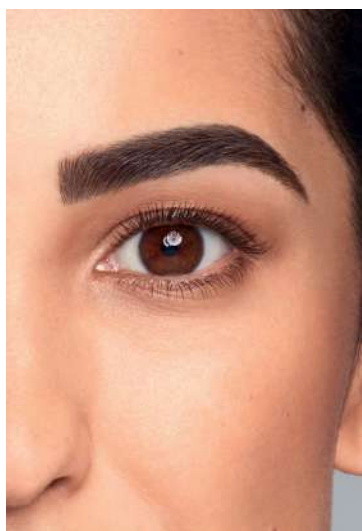
Puna tehnika obrva Za posebno intezivan izgled