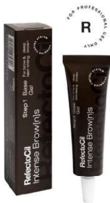
05037 Bazni gel Čokoladno Braon 15 ml

Hladna i pepeljasta nijansa braon koja odgovara neutralnim tipovima boja. Koristi se u kombinaciji sa aktivator gelom.