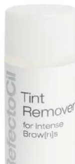
05058 Intense Brow[n]s skidač boje 150 ml

Jednostavan za upotrebu RefectoCil Intense Brow[n]s aktivator gel daje željeni rezultat boje u kombinaciji sa RefectoCil Intense Brow[n]s baznim gelovima. Aktivator gel sadrži srebrni nitrat koji zatamnjuje obrve i trepavice iznutra.