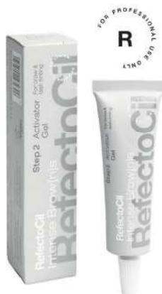
05039 Intense Brow[n]s Aktivator gel 15 ml

Gotovo crna nijansa daje licu snažan okvir. Harmoničan sa crnom kosom ili za stvaranje kontrastnih obrva. Koristi se u kombinaciji sa aktivator gelom.