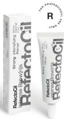
05034 Strong Primer 15 ml

Intense Brow[n]s Intensifying Primer priprema kožu za ravnomerno nijansiranje. Izaberite Intensifying Primer Medium za meksi efekat bojenja kože.