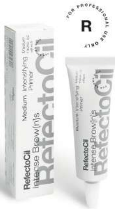
05033 Medium Primer 15 ml

Intense Brow[n]s Intensifying Primer priprema kožu za ravnomerno nijansiranje. Izaberite Intensifying Primer Medium za meksi efekat bojenja kože.