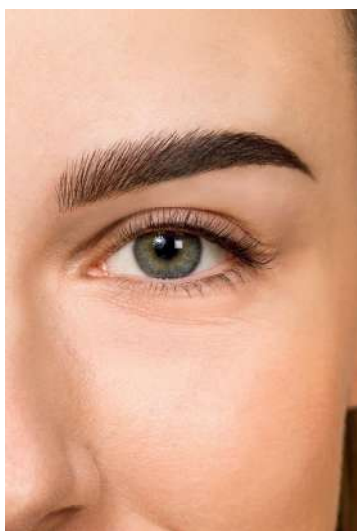
Ombre tehnika senčenja Za prirodan izgled poput perja.